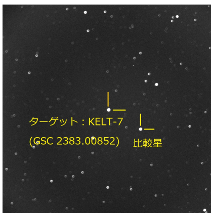
図 1 KELT-7 と比較星

今回の観測および解析対象には KELT-7 を選定した。KELT-7 とその比較星を図 1 に示す。